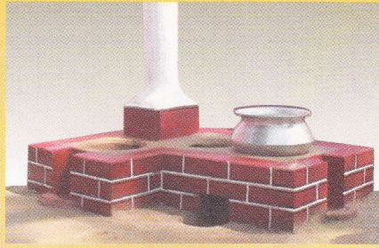
ইটের তৈরী উন্নত চুলা