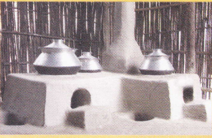
মাটির তৈরী উন্নত চুলা