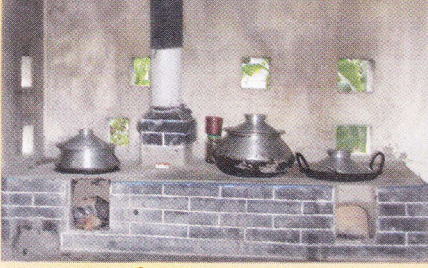
ইটের তৈরী উন্নত চুলা (আই আকৃতি)